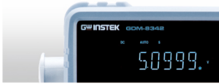
速度不同并不会影响显示位数