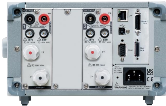
GPM-8320 加裝選購 GPM-DA12