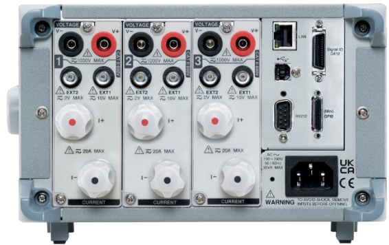
GPM-8330 加裝選購 GPM-DA12