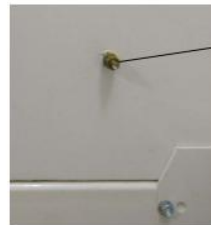
电磁屏蔽箱接地端子