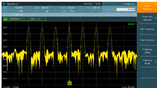
FPC1000 的大动态范围充分利用了 10.1 英寸 WXGA 显示器。