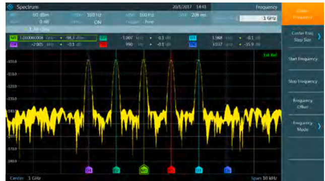
标准功能: 最多六个光标。