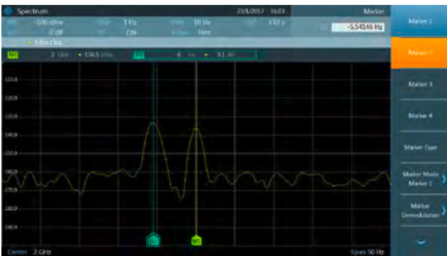
FPC-B22: 1 Hz 分辨率带宽,高灵敏度。